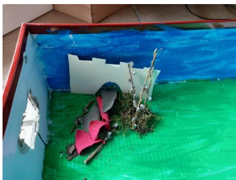
Palmsonntag im Schuhkarton

Man kann auch einen Schuhkarton nehmen oder eine Obstkiste und diese immer weiter ausgestalten. So geht es los mit dem Schuhkarton. Weitere Impulse für die folgenden Tage findet Ihr zum Schuhkarton-Weg auf unserer homepage immer am entsprechenden Tag.