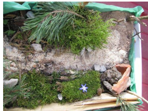
und hier ist das Grab in kleiner Obstkiste