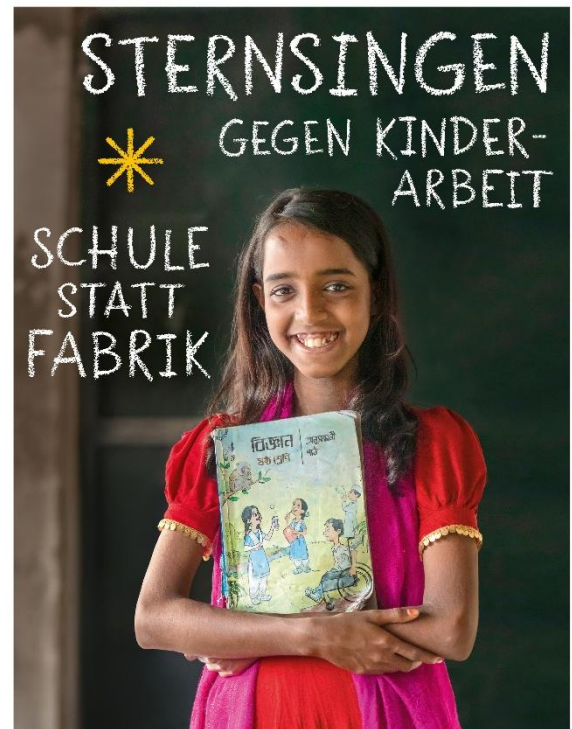
Kindermissionswerk 'Die Sternsinger' Bund der Deutschen Katholischen Jugend (BDKJ)

Das Kindermissionswerk 'Die Sternsinger' e.V. hat das Spenden-Siegel des Deutschen Zentralinstituts für soziale Fragen. Ein Zeichen für Vertrauen.