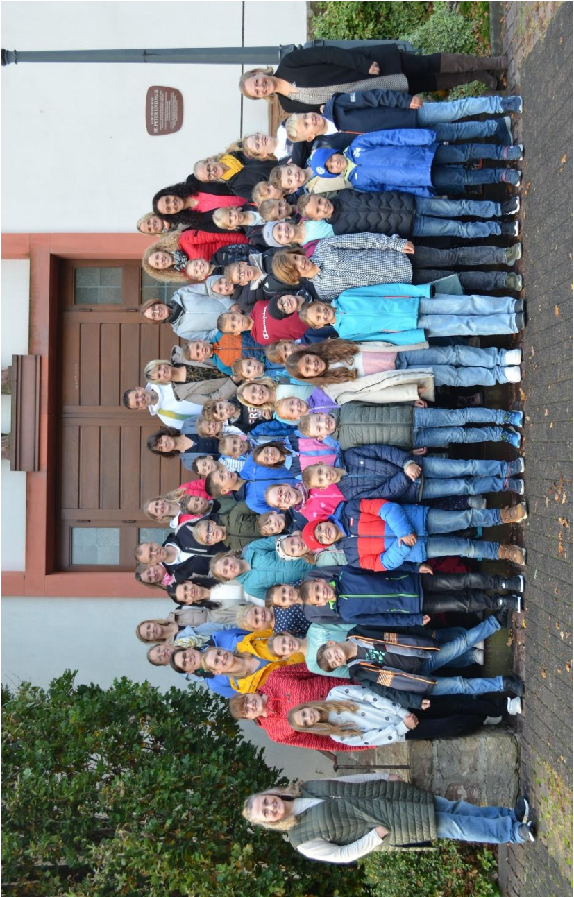
Gemeinsames Foto auf der Kirchentreppe der Eichenzeller Pfarrkirche mit den Kommuniongruppen der Pfarreien Eichenzell und Lütter