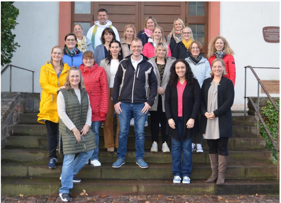
Das Bild zeigt die Kommunionkatecheten aus Lütter und Eichenzell