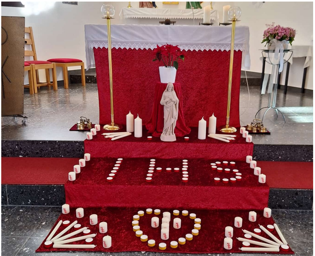
Kerzenaltar in St. Vitus Veitsteinbach im Jahr 2025

Herzliche Einladung zur Eucharistiefeier an Mariä Lichtmess 2. Februar 2026, 10.30 Uhr, in unserer Pfarrkirche St. Sebastian und am vorausgehenden Wochenende!