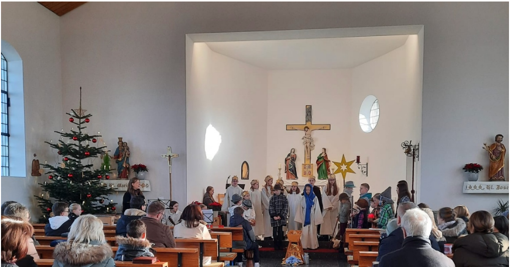
Krippenspiel in St. Vitus, Veitsteinbach