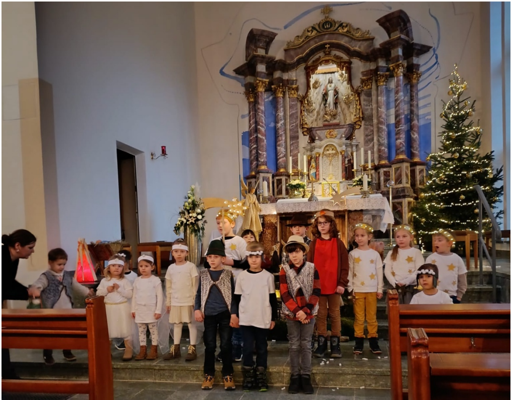
Krippenspiel in St. Bonifatius, Utrichshausen