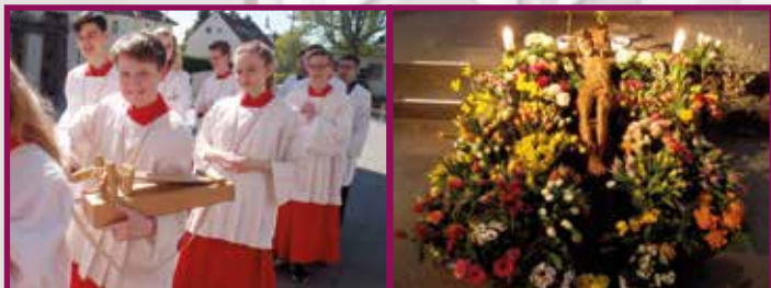
Kreuzverehrung: Glocken in Rom, Liebe zum Kreuz