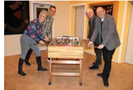
Der neue Vorstand zeigt sich einsatzbereit

henden Herausforderungen machen. Die zu erarbeitenden Vorschläge wer-