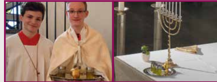
Gründonnerstag Chrisam: Heilige Öle, heilende Wirkung