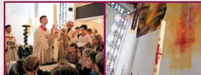
Osternacht: Wasser und Licht, Elemente des Wachstums