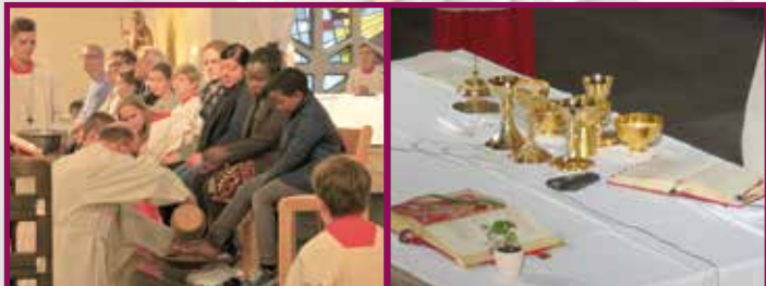
Gründonnerstag Fußwaschung: Dienende Nähe, Zeichen der Gegenwart