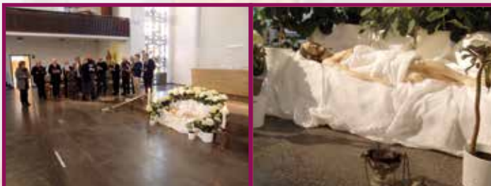
Karsamstag: Hinabgestiegen, Beweinung