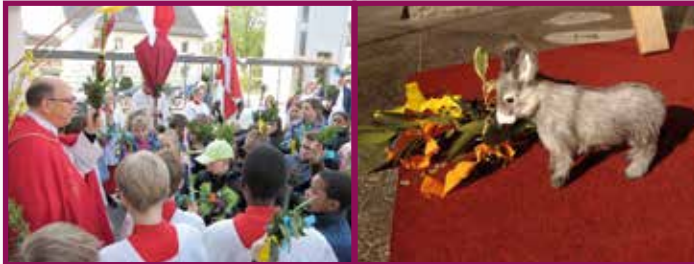
Palmsonntag: Hosianna, Jesu Einzug auf dem Esel