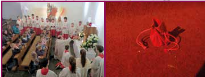
Gründonnerstag Ölbergstunde: Wachen und Beten, Stunde des Verrates