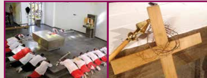
Karfreitag: Niedergeworfen, Stunde des Todes