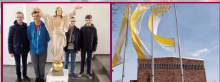
Osterzeit: Begegnung mit dem Auferstandenen, Wehende Fahnen