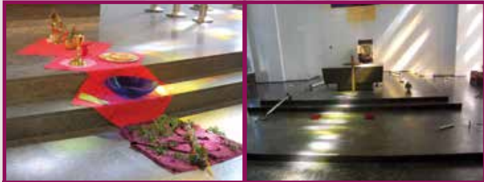
Karwoche: Weg zum Licht