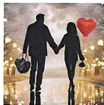
Segensfeier am Valentinstag

Am Freitag, 14. Februar um 19.00 Uhr laden wir wieder liebende Paare zur Segensfeier ein, diesmal in unsere Kirche Maria Königin in Meerholz-Hailer. Die Wortgottesfeier wird musikalisch von der Gruppe "Stimmband" begleitet. Am Ende der Feier besteht die Möglichkeit, sich als Paar segnen zu lassen und die Liebe unter den Segen Gottes zu stellen, um dadurch Stärkung und Begleitung auf dem gemeinsamen Lebensweg zu erfahren. Im Anschluss sind alle zu einem Glas Sekt in den Pfarrsaal eingeladen.