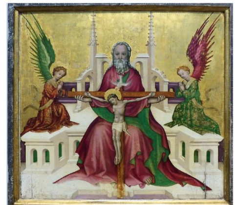
Die Dreifaltigkeit mit dem gekreuzigten Christus, um 1410